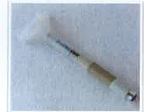
<밴드형, 마우스피스형 기표용구>